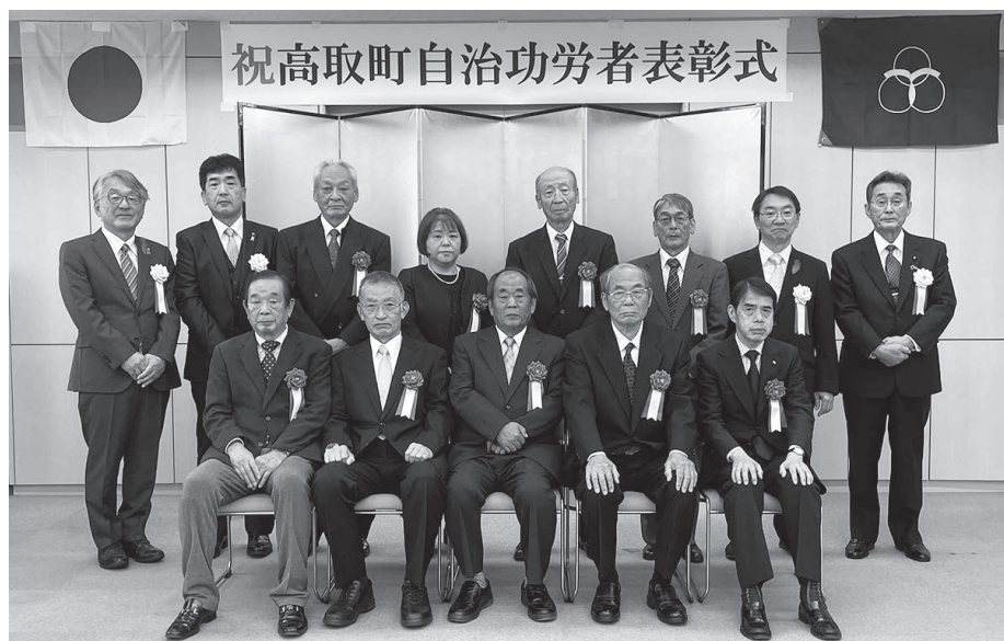
祝高取町自治功労者表彰式