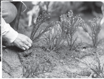
▲早乙女による田植え