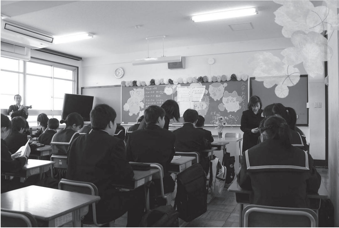
▲みんなで仲良く頑張りましょう！