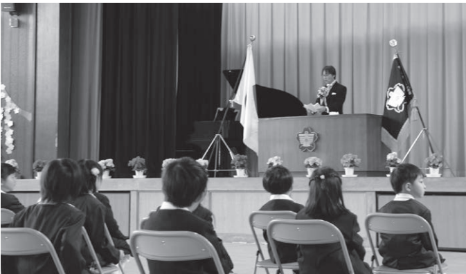
▲たかむち小学校 入学式

たかむち小学校は4月7日に、高取中学校は4月8日に入学式が行われました。 新しい季節の彩りとともに、新入生たちは緊張した面持ちで入学式に臨みました。