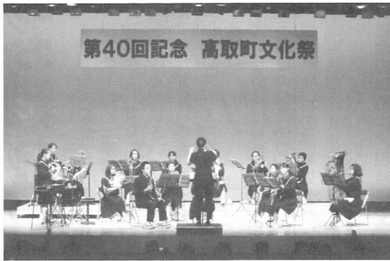
第40回記念 高取町文化祭

多くの市民の皆さんが日頃の練習の成果を披露しました。230名を超える出演者による熱気あふれるステージは、和太鼓「笑」の演奏で最後を締めくくり、客席からは大きな拍手と歓声が沸き起こっていました。 秋の恒例行事である文化祭は、たくさんの方々の笑顔の中、大成功のうちに幕を閉じました。