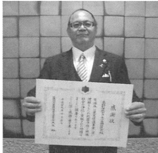
近畿地方更生保護 委員長感謝状 高取町防犯ボランティア連絡協議会

10月20日(金)に開催された奈良県更生保護事業関係者顕彰式典で次の方が受賞されました。