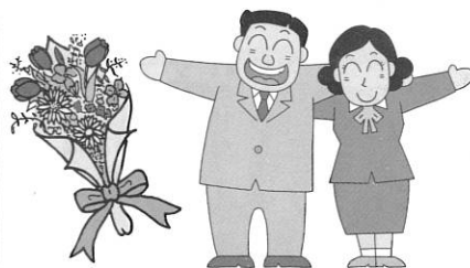
奈良保護観察所長感謝状 社会福祉法人高取町社会福祉協議会