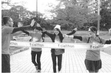
申し込みは 謎解き 飛鳥シャルソン 検索

イベント終了後は、一番おもしろいSNSを投稿した人を決めるSーべらんぶり、謎解きの答え合わせをするアフターパーティ(交流会)を開催します。頭と体をフルに使って秋の飛鳥路を満喫しましょう!