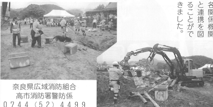
奈良県広域消防組合 高市消防署警防係 0744(52)4499

総雨量が1,000mmを超える豪雨で住宅地に土石流が流れ込み、多数の要救助者が発生したとの想定により開始しました。訓練は、災害救助犬による要救助者の検索が行われ、要救助者が埋没されている状況から、土木建設会社等が重機を使って瓦礫等を撤去した後に、要救助者を消防隊および救助隊が救出しました。