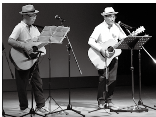
▲楽器を奏でて・・・。

皆さんは日頃、周りの人と笑って楽しく過ごしていますか。本町には「歌って笑ってお喋りする楽しい時間」を共有して人生を謳歌していただきたい」との思いで活動しているバンドグループ「高一歌笑楽団」があります。今月は、熱心に練習を重ね、楽しい時間を共有する「高一歌笑楽団」の皆さんの様子取材しました。