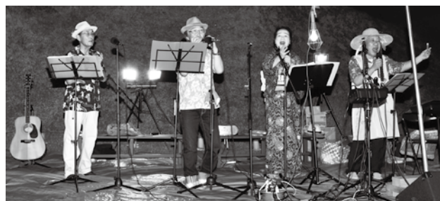
▲市尾墓山古墳燈火会での演奏